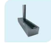
ABS UL 94V-0